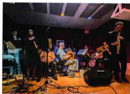
The Jazz Gallery NYC